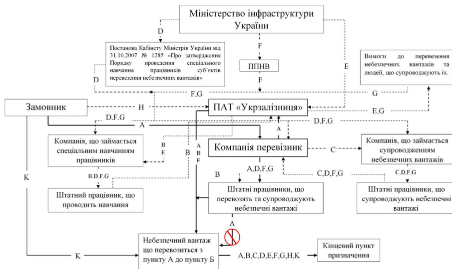
Рис. 1. Схематична модель взаємодії підрозділів АТ «Укрзалізниця» з іншими суб'єктами перевезення.

небезпечних вантажів, то вона може звернутись до компанії що займається супроводженням небезпечних вантажів (потік С). Для проведення спеціального навчання АТ «Укрзалізниця» може звернутись до компанії, що займається навчанням працівників (Потік В). Ця компанія виділяє штатного співробітника, який(ка) проводитиме спеціальне навчання співробітників. Після того як штатний працівник компанії перевізника, пройде спеціальне навчання, отримає відповідні сертифікати, та дотримається інших вимог, після чого компанія перевізник може взяти участь у перевезенні вантажу разом із АТ «Укрзалізниця» для замовника із пункту А до пункту Б, (Потік А). Потік А на схемі позначений суцільною лінією, тому що він є основним потоком у схемі, усі інші потоки позначені штрих-пунктирною лінією, бо вони лише додаткові потоки, які так чи інакше впливають на потік А, або коригують його. На схемі також є потік К який означає, лише небезпечний вантаж, який потрібно перевезти для замовника з пункту А до пункту Б.